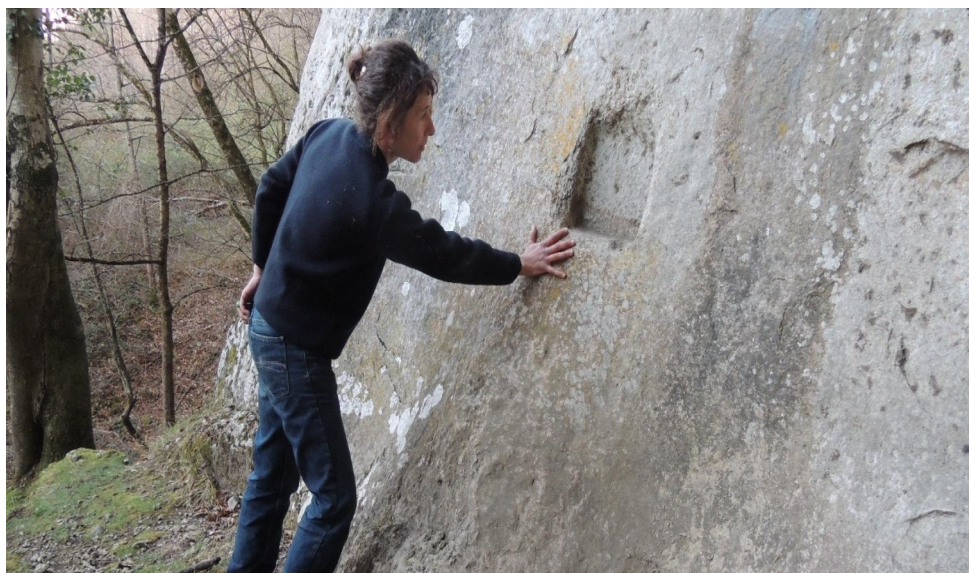
Nicho ena entrada dera còva de Sentaraille. Trobath