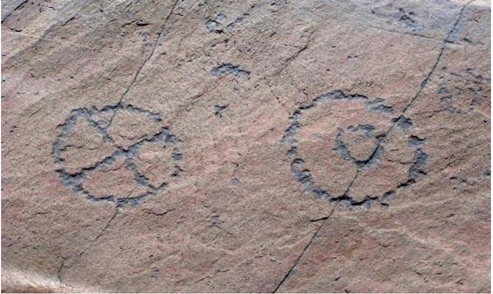
Detalh de dues versions de cercle gravat dera pèira der Horcalh.