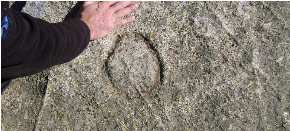
Protocercle gravat. Arriu Malo. Òrri