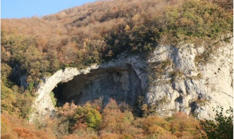
Eth pòrge dera còva deth Malh de Faucon.