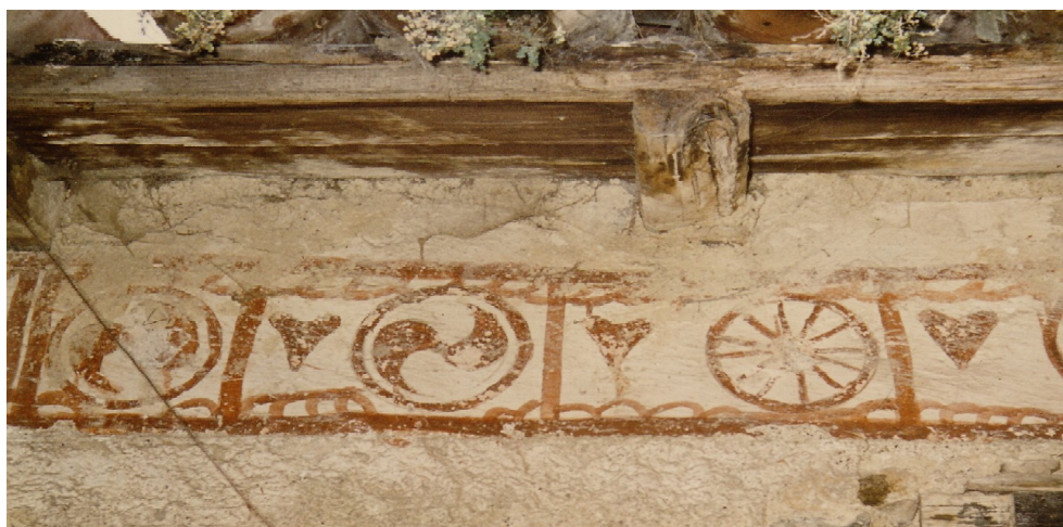
Frisa jos tet. Rodèles, Miei lauburu, còr marian.