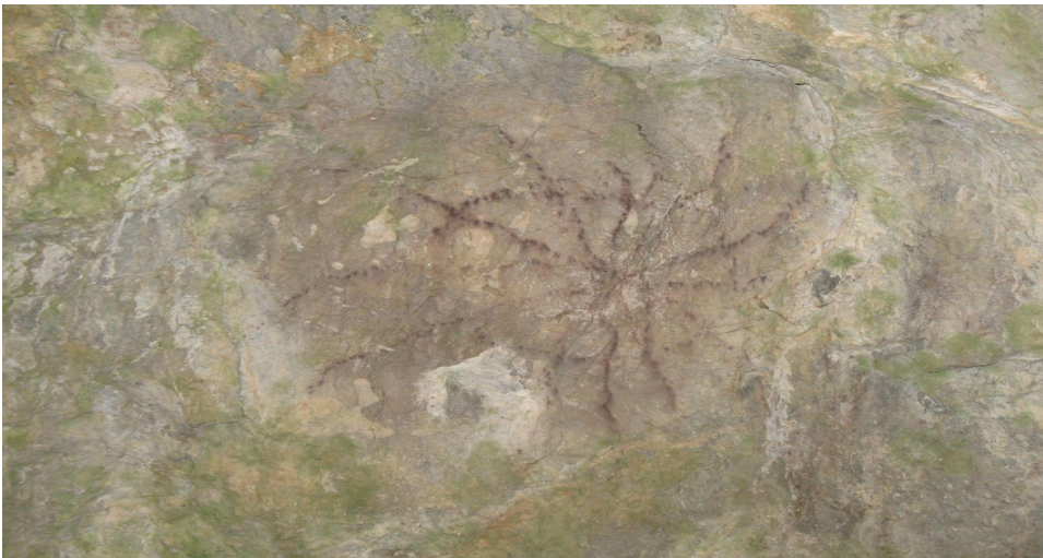
Cercle radiant ar òcre. Còva der Escarrabèr. Teba