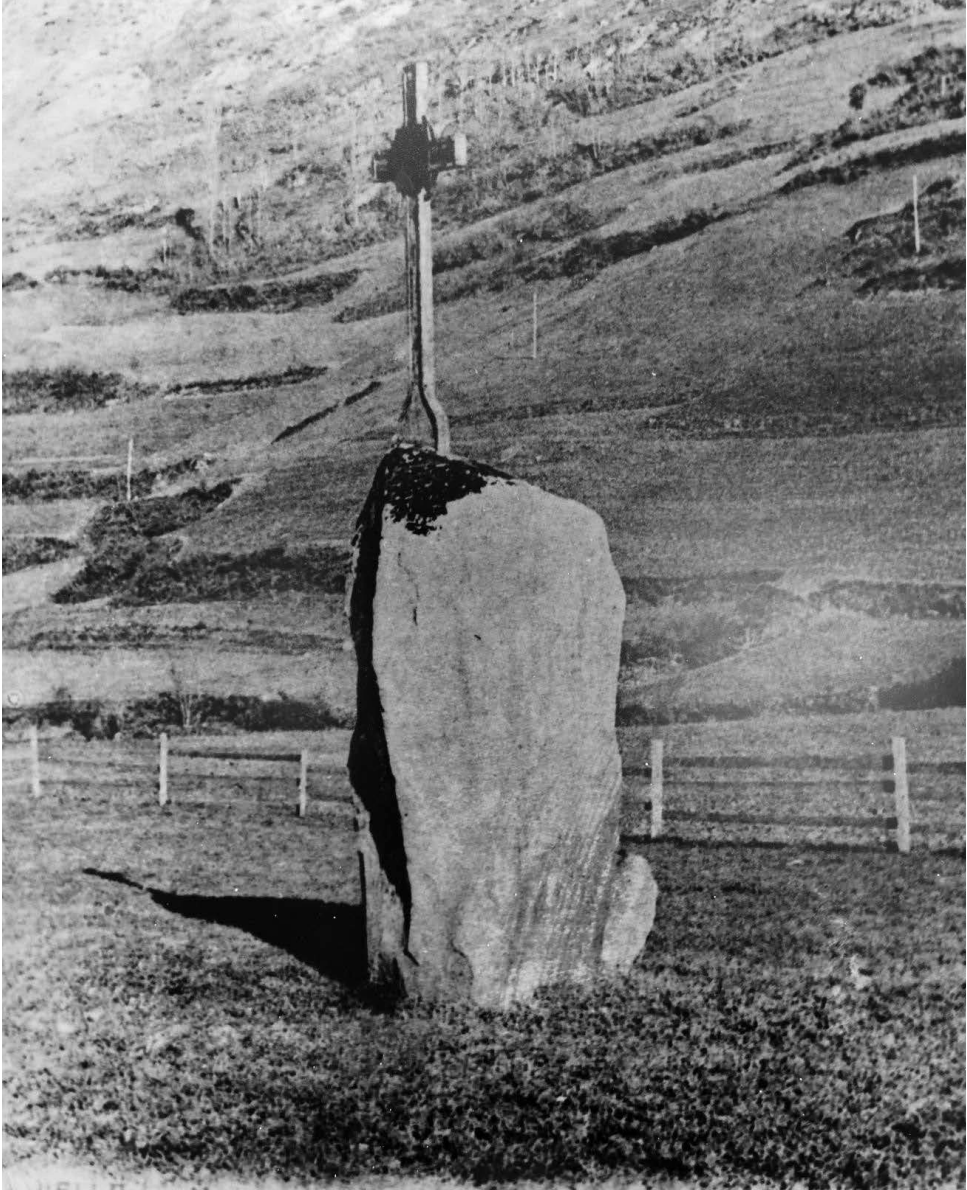
Pèira de Mijaran damb era Crotz dera Mission Generau dera Val d'Aran de 1906.