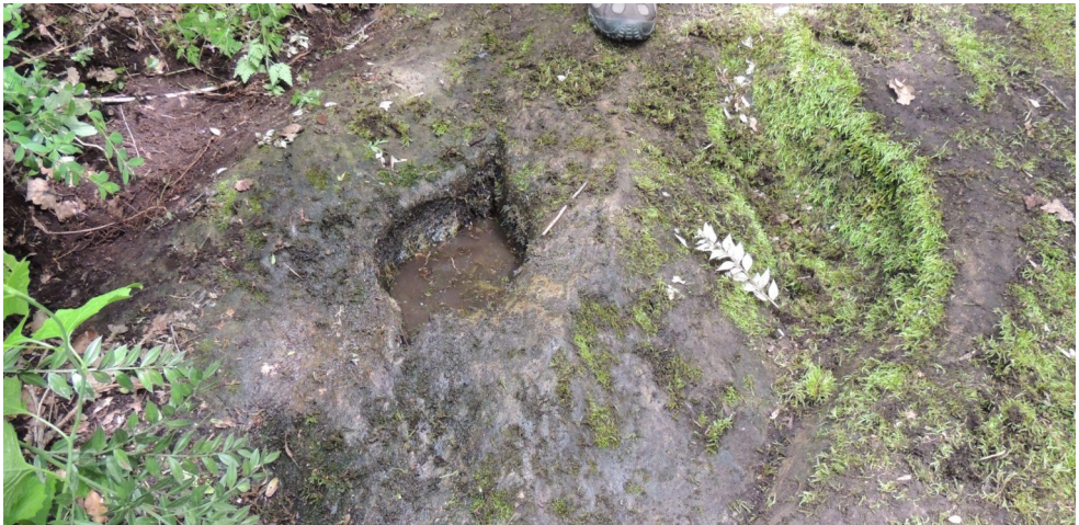
Gravat en forma de vulva e microcoples. Geri. Marinhac