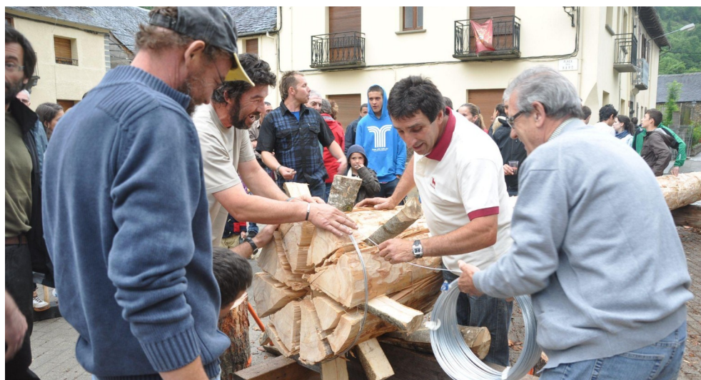
Cerclatge deth tronc. Les