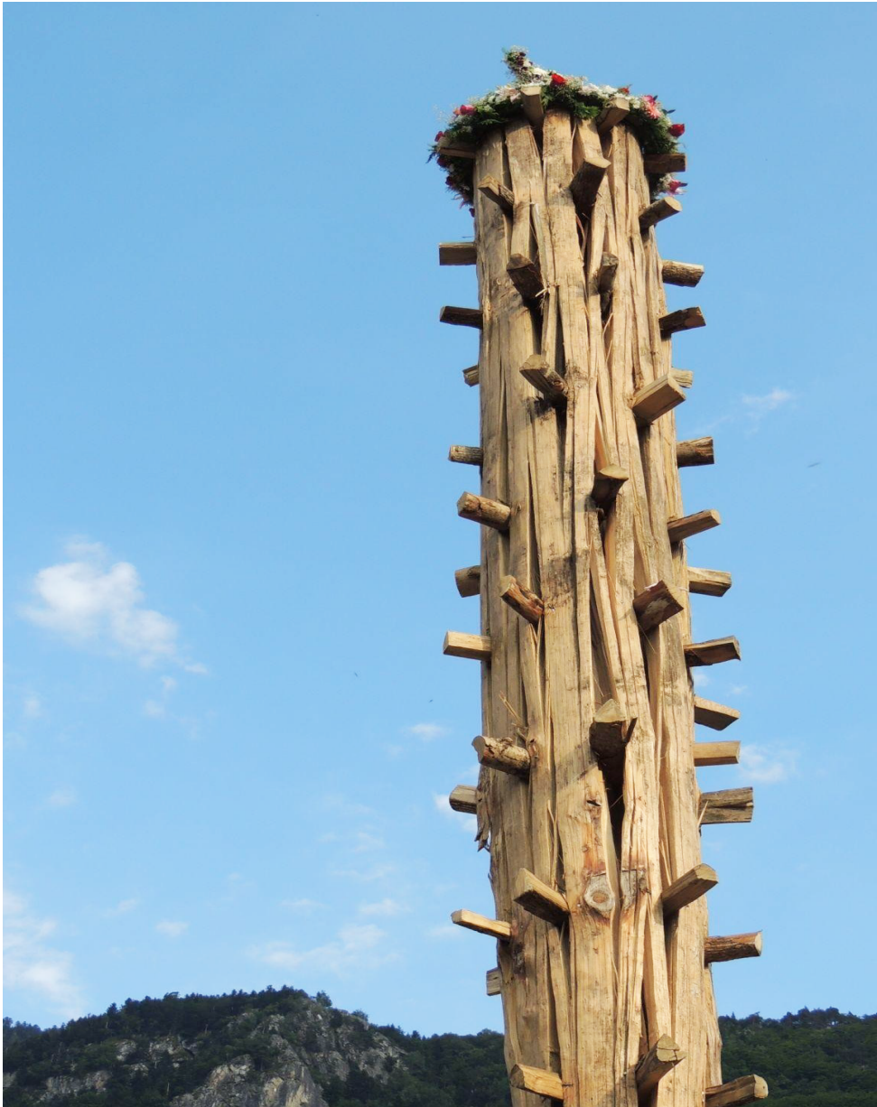
Er haro de Les. Simbòl e òbra d'art.