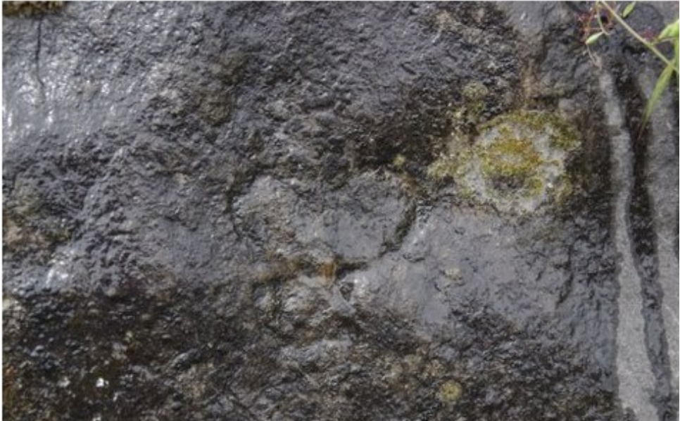
Picada neolítica. Eth signe cornut apròp dera cuba. Geri. Marinhac