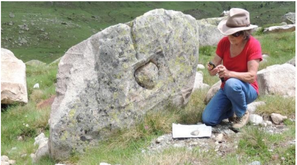
Protocercle gravat. Òrri