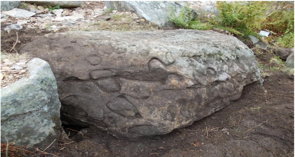
Protocercles gravats en bòrd deth vielh camin de Bacivèr. Arriu Malo. Beret.