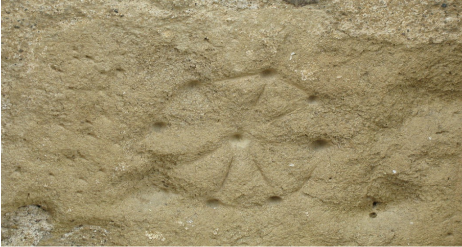
Reutilisacion d'un bloc damb soleïforme intern gravat (Neolitic o Bronze) en mur dera Glèisa de Sarremezan.