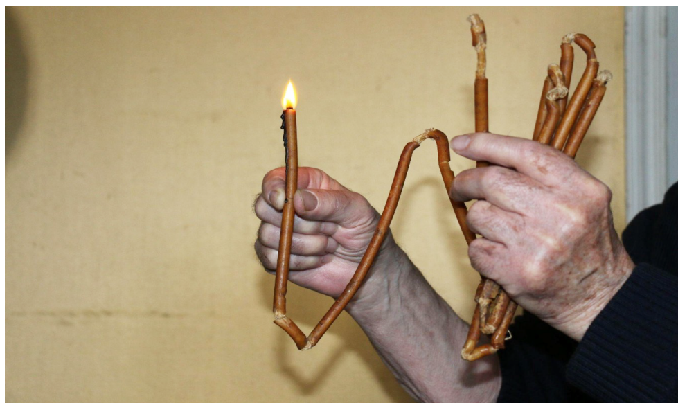
Era candela de plec alugada