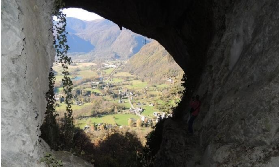
Era plana dera Garona vista des dera còva deth Malh de Faucon. Protocercle gravat ena paret quèrra.