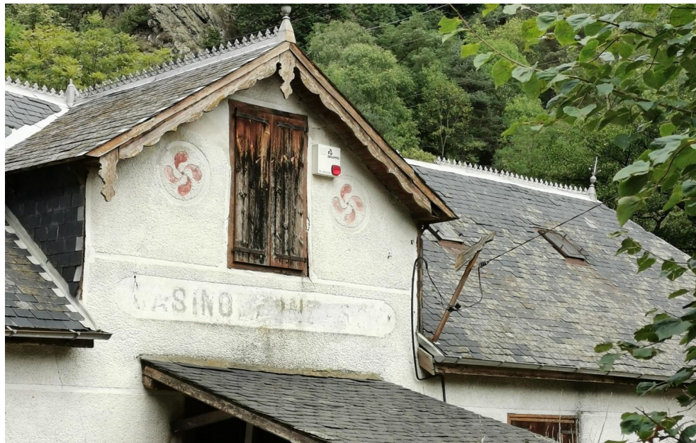
Lauburus o esvastiques ena façada deth Casino de Pònt de Rei.